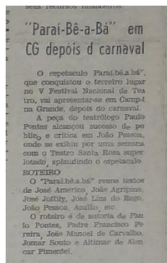
Figura 3 – Reprodução do jornal Diário da Borborema de 22 de fevereiro de 1968

O último recorte data de 22 de fevereiro de 1968 e constitui uma nota acerca da peça na qual acrescenta a informação de que esta ganhou o 3º lugar no V Festival Nacional de Teatro, apresentando novamente a informação de que a peça será apresentada em Campina Grande depois do carnaval. Comenta da exibição da peça em João Pessoa que, durante uma semana, foi sucesso de público com casa cheia e aplausos de pé.