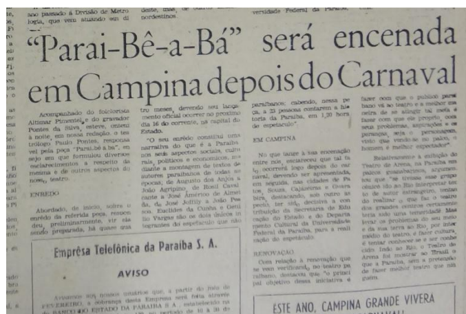
Figura 1 – Reprodução do jornal Diário da Borborema de 11 de fevereiro de 1968

O autor, através dos recortes literários e narrativas escolhidas para compor o enredo da peça, opta por retratar a resistência do povo paraibano diante das adversidades e como esse povo, apesar de tudo, resiste. Diante de vários aspectos e tradições que poderiam ter sido escolhidos para retratar o paraibano, Pontes escolhe mostrar a resistência popular como meio de enaltecê-la por considerar essa a principal característica dos seus conterrâneos. Tanto que a música Asa Branca de Luís Gonzaga é utilizada na peça entre as passagens de cena, reforçando a necessidade de ser forte principalmente diante da seca, principal fator que afasta o homem do campo da sua terra, através do êxodo rural e da emigração que leva os nordestinos para o sudeste há tempos.