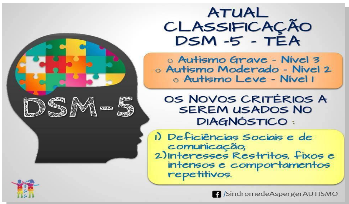
Figura2: Classificação atual DSM-5-TEA