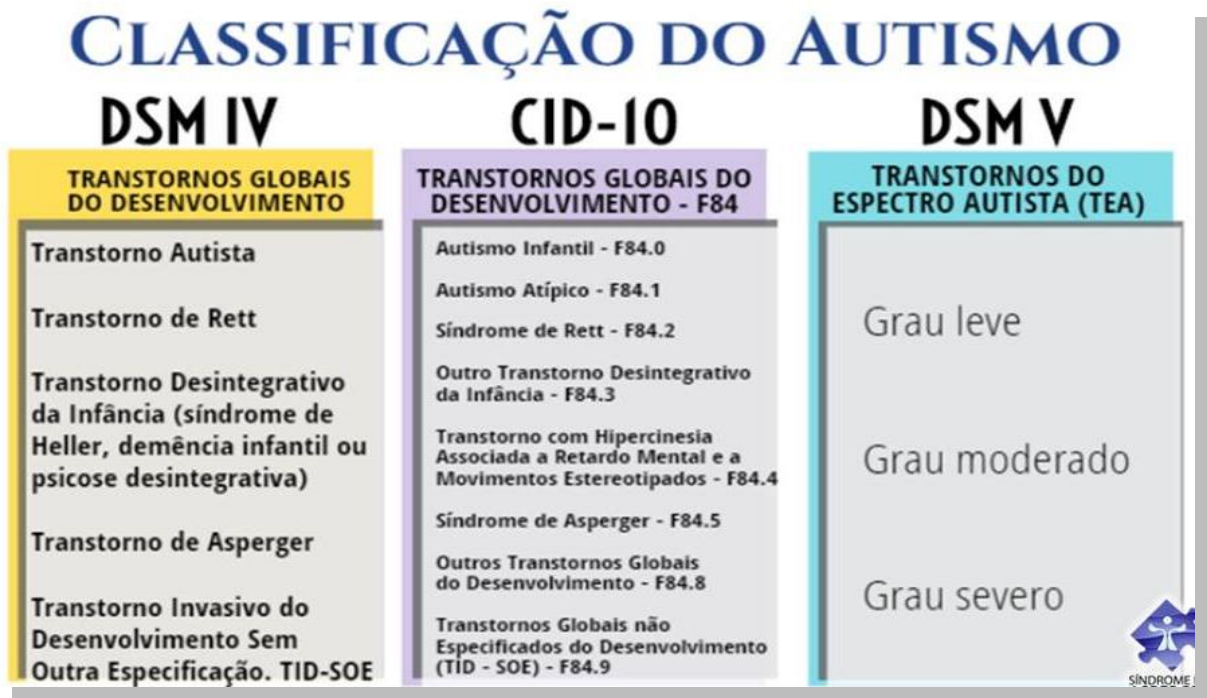
Figura1: Classificação atual DSM-5-TEA

englobariam cinco transtornos e as crianças que apresentassem as referidas disfunções podiam ser diagnosticadas com: Transtorno Autista, Transtorno de Rett, Transtorno Desintegrativo da Infância, Transtorno de Asperger e Transtorno Global do Desenvolvimento Sem Outra Especificação (PDD-NOS).