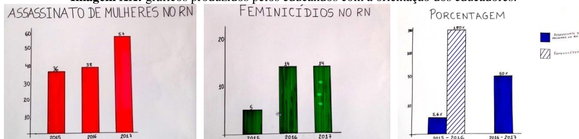
Imagem XX: gráficos produzidos pelos educandos com a orientação dos educadores.

Para trabalhar o enfrentamento da violência contra a mulher no Rio Grande do Norte a Escola criou o Projeto de Proteção e Valorização da Mulher. Seu objetivo era problematizar o papel da mulher e o seu lugar na sociedade, enfatizando o absoluto repúdio às atitudes machistas, preconceituosas e discriminatórias, somado a todo e qualquer ato de violência cometido na sociedade, em especial, contra as mulheres.