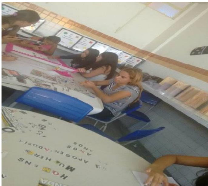
Figura 5: Alunos confeccionando os cartazes da Previdência.