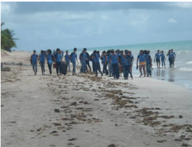
Praia de Formosa – Cabedelo-PB, em: 06/05/2015. Figura 1: Autoria própria.

Após a aplicação desse questionário em 2015, iniciamos o processo de planejamento e desenvolvimento de práticas de Educação Ambiental que consistiram em aulas de campo com propostas de discutir medidas de conservação e preservação das áreas que ocorreram os estudos, diagnosticando as potencialidades dos seus recursos naturais. Segue registros fotográficos das aulas de campo desenvolvidas neste trabalho (figuras 1 e 2).