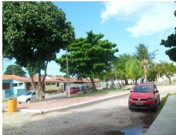
Praça da Palmeira – Cabedelo-PB, em: 07/05/2015. Figura 2:

Na figura 1, referente à aula de campo na praia de Formosa, focalizamos principalmente a coleta e o descarte apropriado dos resíduos sólidos no meio ambiente. Enquanto que, na praça da Palmeira, (figura 2), realizamos juntamente com os alunos a observação das formas de conservação e uso de maneira sustentável do solo urbano.