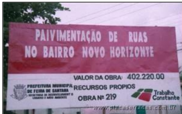
Figura 4 – Placa de obra de Prefeitura