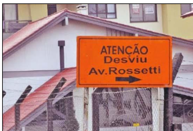
Figura 5 – Placa em avenida