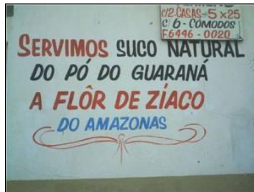
Figura 3 – Placa de suco natural de guaraná