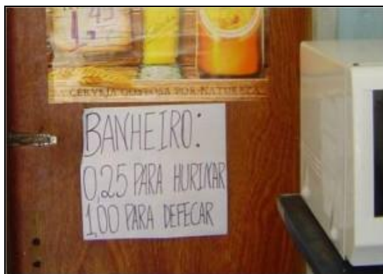
Figura 2 – Placa em banheiro