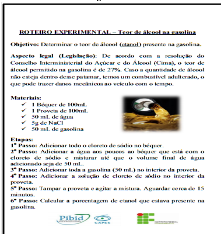
Figura 1: Roteiro Experimental recebido pelos alunos para análise do teor de álcool presente na gasolina.

Depois de realizada a análise os estudantes compararam o resultado encontrado com o valor estabelecido pela legislação, os resultados apresentados nas três turmas apontaram a amostra da gasolina comercial como estando adulterada. O quadro 1 apresenta os dados, cálculos e as respostas da situação problema, obtidos nos três grupos da turma A.