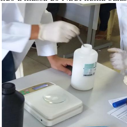
Figura 2: Aluno medindo a massa do NaCl numa balança de precisão.

Depois da prática e divulgação dos resultados, passamos a discutir os aspectos que eles observaram no experimento, como por exemplo, o porquê da gasolina ficar sobre a água após a mistura e não em baixo, mostrando que a mesma é menos densa que a água, e assim relembrar o conceito de densidade, e o porquê foi acrescentado sal na água antes de misturar com a gasolina mostrando que dessa forma aumenta a polaridade do meio. Nessa parte em especial discutimos mais profundamente os conteúdos de química: misturas, densidade, solubilidade, solução, polaridade, hidrocarbonetos e funções orgânicas.