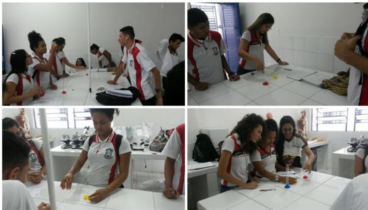
Figura 2: Alunos desenvolvendo atividades práticas no laboratório.

com instrumentos do cotidiano de um cientista, as atividades experimentais podem servir para diminuir o abismo que muitas vezes é observado entre o dia a dia escolar dos estudantes e as questões ligadas à Ciência e à Tecnologia.