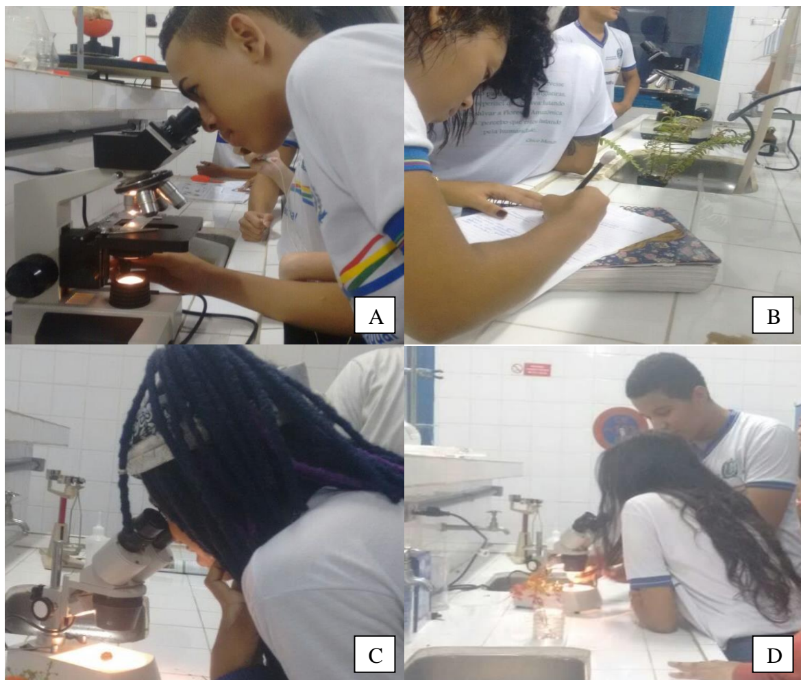
Figura 02: Aluno visualizando um esporófito no microscópio (A); Aluna desenhando uma samambaia (B); Aluna observando um estróbilo com sementes de uma gimnosperma na lupa (C); Alunos colocando partes da flor de C. pulcherrima na lupa.

Os assuntos acabaram se relacionando com outros. Ao falar sobre a importância da polinização nas angiospermas os educandos sempre relembavam da participação de animais, principalmente das abelhas. Silva e Barbosa (2011) abordando os órgãos reprodutores das angiospermas por meio de uma aula prática também trabalharam a importância da polinização e dos agentes polinizadores. Além disso, foi possível discutir as diferenças entre monocotiledôneas e dicotiledôneas e a dispersão de sementes, onde os educandos citavam principalmente as ocorrentes devido aos ventos e aos animais.