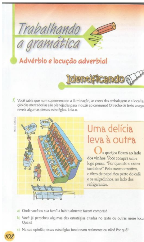
Figura 03

De acordo com essa nova proposta de trabalho da gramática, em se tratando especificamente do advérbio, o linguista, PERINI (1995, p. 37), define o uso do advérbio como um misto entre sintaxe e semântica, por compreender que a modificação indica que um advérbio teria seu significado unido ao de um outro elemento formando um todo semanticamente integrado. Dessa forma, de acordo com Bechara (2004),