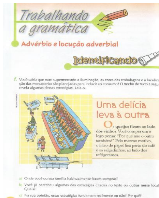
Figura 01

O volume apresenta o emprego dos advérbios através de textos pertencentes aos gêneros: instrucional e informativo. Estes foram usados como pretexto para a introdução do conteúdo. Em seguida, apresenta o conceito gramatical clássico de adjunto adverbial.