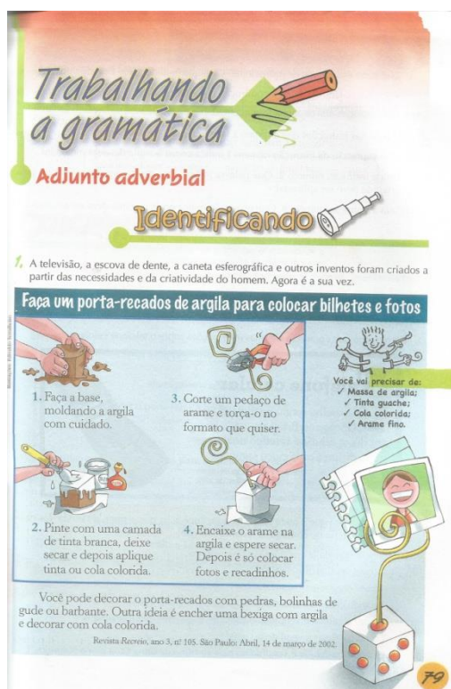
Figura 02

A ordem dos conteúdos está inversa, uma vez as autoras deveriam iniciar os trabalhos apresentando, nos textos, a classe dos advérbios e somente após essa apresentação é que deveriam ser apresentados aos alunos os termos que têm a mesma função que eles, ou seja, indicar circunstâncias diversas. Estes termos são: locução adverbial e oração adverbial. A partir daí seria trabalhada a função sintática destes termos que é desempenhar o papel de adjuntos adverbiais.