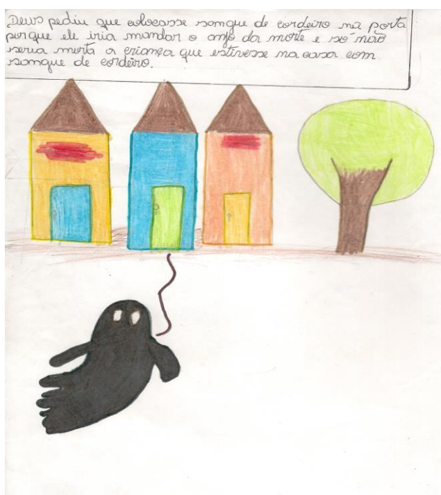
Figura 1: Representação da passagem bíblica sobre a morte dos primogênitos.

Feito isso, o segundo passo foi levá-los em grupos de três componentes para a sala de informática, para que identificassem todo o material necessário para a construção da história em quadrinhos, para tal, foi seguido um roteiro elaborado anteriormente na sala de aula em conjunto com os alunos.