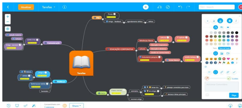
Figura 1: Ferramenta MindMeister

Além do MindMeister , outra ferramenta interessante escolhida para a elaboração de mapas mentais é a Coggle , uma aplicação online , portanto, pode ser acessada de qualquer lugar basta somente ter um dispositivo e conexão com à Internet. A ferramenta caracteriza-se por ser gratuita e, para utilizá-la, o usuário deve possuir uma conta do Gmail com a qual será possível acessar o sistema. A Figura 2 abaixo mostra um exemplo de mapa mental criado com a Coggle , representando as funcionalidades e características que a ferramenta oferece.