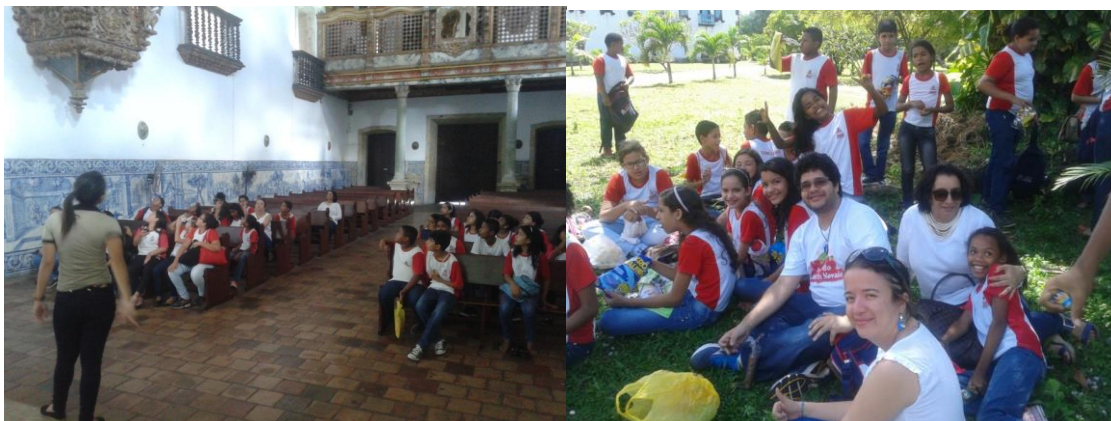
Figura 3 – Visita ao centro histórico.