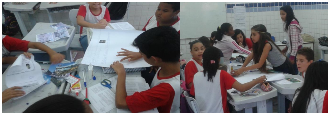
Figura 1 – Confecção de cartazes e textos

Foram produzidas paródias, poesias e textos especialmente com a contribuição dos professores da disciplina de língua portuguesa (figuras 1 e 2). A visão de patrimônio unida ao meio ambiente, no sentido de necessidade de preservação, teve a contribuição dos professores dos componentes curriculares Ciências e Geografia. Sobre os gastos públicos acarretados pela depredação do patrimônio e os impostos que se pagam para que este patrimônio seja garantido, houve especial atenção do componente curricular Matemática. A exposição do significado da palavra patrimônio a nível escolar e municipal contou com o subsídio especial da disciplina de História. O professor responsável pela disciplina de Artes teve a oportunidade de fazer pinturas do patrimônio de João Pessoa.