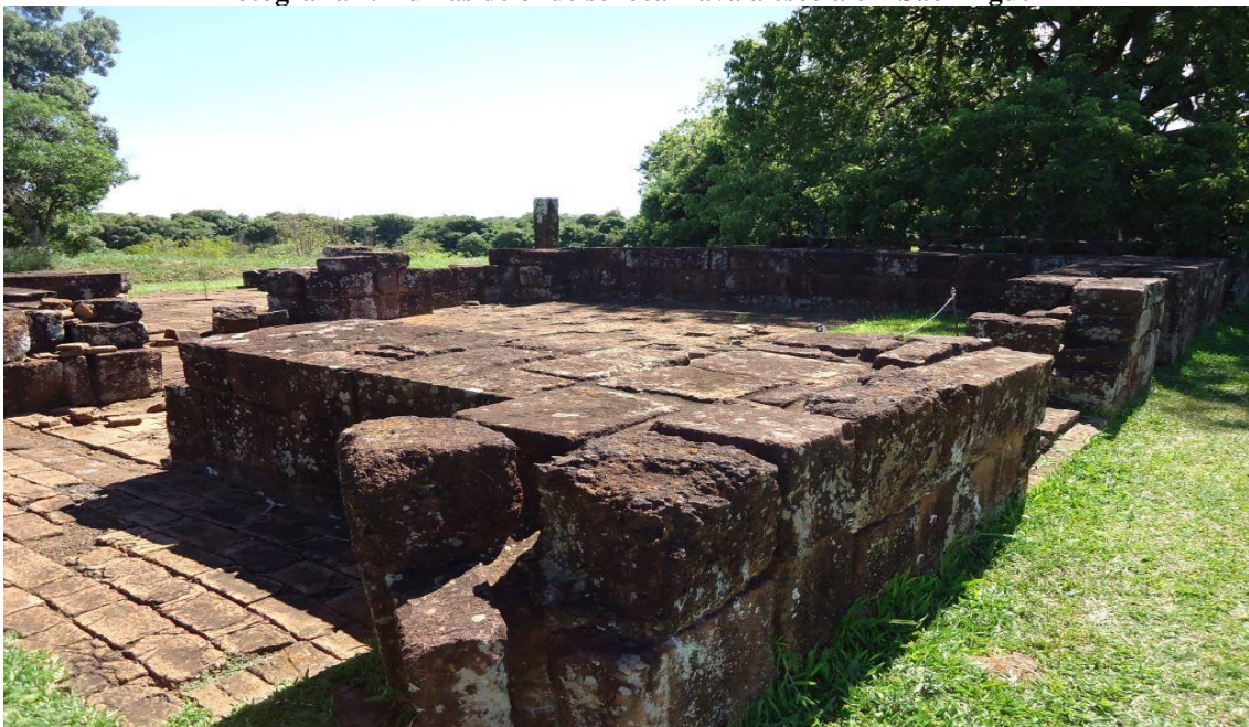
Fotografia I: Ruínas de onde se localizava a escola em São Miguel

A fotografia a seguir, identifica o local utilizado e construído como sala escolar na redução de São Miguel das Missões. Em todos os outros compartimentos destinados as oficinas, casas dos indígenas e demais agrupamentos de pedras, estes eram de chão batido. Porém as salas destinadas a formação intelectual apresentava chão minunciosamente trabalhado em pedras de igual tamanho.