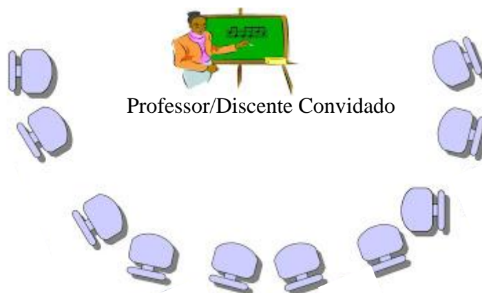
Figura 1. Ilustração da conformação semicírculo para discussões da disciplina.