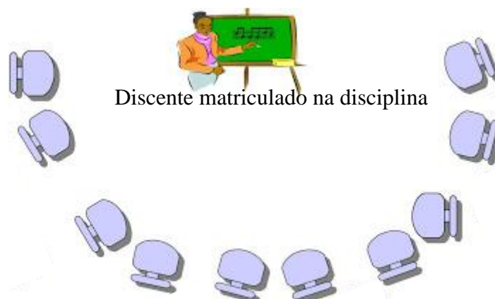
Figura 6. Ilustração da conformação semicírculo para discussões da disciplina.