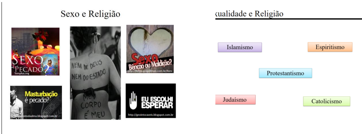
Figura 3. Aula sobre sexualidade e religião

Após essa temática, iniciamos as discussões sobre parafilias e dentre elas pedofilia, necrofilia, zoofilia, sadomasoquismo, ninfomania. Essas aulas fomentaram uma boa discussão, visto que parafilias não são temas muito discutidos durante a graduação em biologia licenciatura. Durante as aulas, fez-se mister abordar questões biológicas, sociais e psicológicas. Na Figura 4, podemos observar alguns tópicos dos seminários.