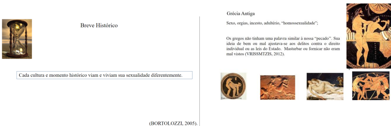
Figura 2. Aula sobre histórico da Sexualidade

Após esse seminário, foi abordada a temática sexualidade e religião e essa foi a temática que mais causou discussões entre os alunos da disciplina, alguns defendendo a visão das mais diversas religiões, outros defendendo a visão de se viver sexualidade como se bem entender. Algumas