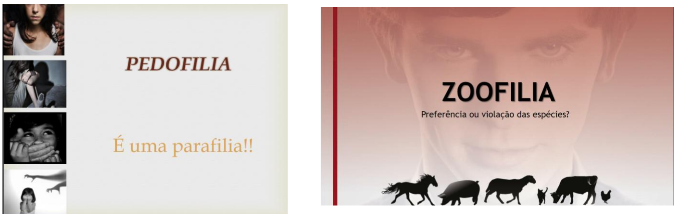
Figura 4. Aula sobre Parafilias

Outra temática discutida foi a prostituição, onde foi realizado um histórico sobre prostituição, englobando aspectos de como ela era vista nas antigas civilizações até os dias atuais. A figura 5 representa a aula sobre prostituição.