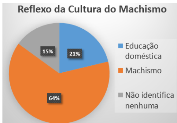
Figura 3: Olhar dos professores na Cultura do Machismo no comportamento dos alunos (Queimadas/PB - Julho de 2017)