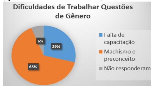
Figura 2: Dificuldades dos docentes (Queimadas/PB - Julho de 2017)