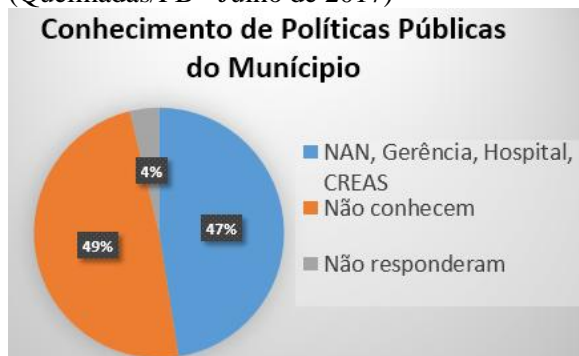
Figura 5: O conhecimento dos docentes em relação as políticas públicas para a mulher (Queimadas/PB - Julho de 2017)