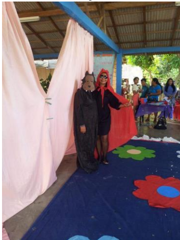
Figura 01. Peça teatral.

Assim colocamos em prática juntamente com a escola e comunidade ações para minimizar a problemática do acúmulo de lixo e combater o mosquito. Cada professor orientou sua turma na realização das atividades propostas houve apresentação de seminários, aula de campo onde os alunos identificaram as larvas, confecção de cartazes, desenhos de combate ao lixo, apresentação de peça teatral, paródia, gincana, propor reduzir reutilizar, recuperar, renovar e reciclar o lixo, vídeo com proposta de trabalhar os 5Rs, lanche compartilhado, assim como a elaboração de uma cartilha que se tornou um riquíssimo material educativo.