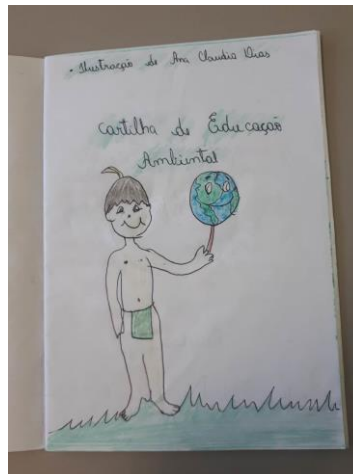
Figura 02 e 03: Aula de campo e Cartilha

Esse trabalho foi de suma importância, pois envolveu toda comunidade, onde os mesmos puderam participar ao longo das ações desenvolvidas pelos alunos e chegaram a alcançar seu objetivo no dia da culminância onde envolvemos os pais dos alunos juntamente com todos os moradores pudemos perceber que as aulas ficaram mais prazerosas e dinâmicas e notamos claramente que eles passaram a cuidar melhor do seu meio que estão inseridos e que são capazes de transformar o espaço onde estão vivendo.