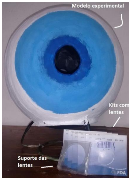
Figura 1: Modelo experimental de frente