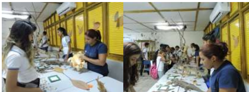
Figura 2- Exposição interativa de animais taxidermizados

A realização da prática demonstrativa com os animais taxidermizados (Fig.2) proporcionou aos estudantes conhecer a fauna encontrada da região do Rio Grande do Norte, os hábitos de vida das espécies (alimentação, reprodução e habitat), bem como, o exercício da prática de conscientização para conservação de espécies silvestres e como funciona a prática de taxidermia. Durante a preparação e realização da atividade prática, percebemos uma motivação maior dos alunos e disponibilidade para cooperar e participar na elaboração de um cenário simulando os elementos mais próximos da vida silvestre, o que culminou na redução no número de evasão escolar, por parte dos estudantes.