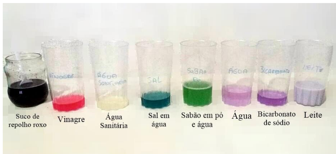
Figura 1: Materiais e soluções após a adição do indicador de pH.

Durante a aplicação do experimento, os alunos se mostraram empenhados em aplicar o indicador natural de maneira correta nas substâncias selecionadas, solicitando a ajuda dos colegas do grupo. No momento da identificação das soluções ácido, bases e neutros poucos grupos confundiram, outros já acumulavam mais acertos. Foi notório que os alunos de ambas as turmas compreenderam o processo de mudança de coloração das soluções (Figura 2), considerando o ótimo desempenho na atividade exposta durante a prática laboratorial.