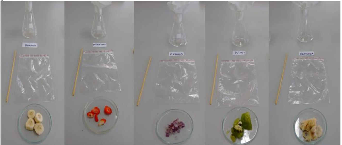
Figura 1: Amostras das cinco plantas utilizadas na pesquisa: morango, banana, cebola, kiwi e graviola.