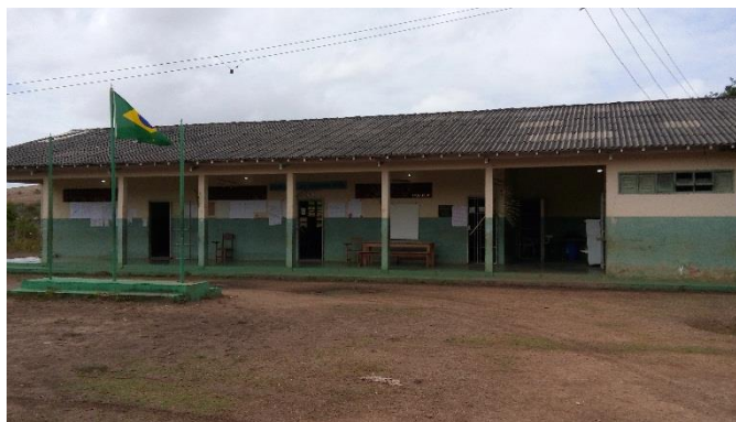
Figura 2. Prédio Escolar Estadual Indígena Bernardo Sayão

Com o crescimento da população e o contato com os não índigenas, houve a necessidade de implantação de escola, onde a comunidade foi contemplada em 1993 com um novo prédio, este que funciona até hoje com 03 salas de aula. A escola atende cerca de 148 alunos nos três turnos, com três modalidades, sendo que no turno matutino estudam 04 turmas. A seguir apresento a foto atual do prédio escolar (Figura 2).