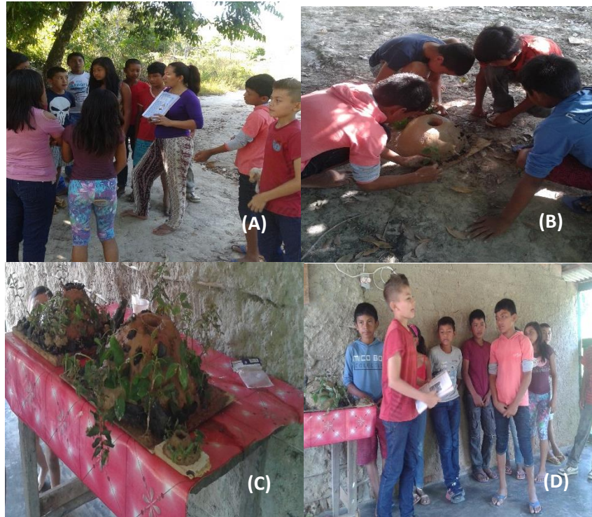
Figura 5. (A) Apresentação da proposta de atividade; (B) Construção dos vulcões; (C) Resultado Final da construção dos vulcões; (D) Apresentação dos vulcões pelos alunos.

Resultados alcançados: Foi uma experiência muito boa tanto para mim quanto para os alunos.