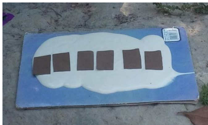
Figura 4. Os movimentos das placas tectônicas

Resultados alcançados: A compreensão dos movimentos das placa tectônicas e suas consequências.