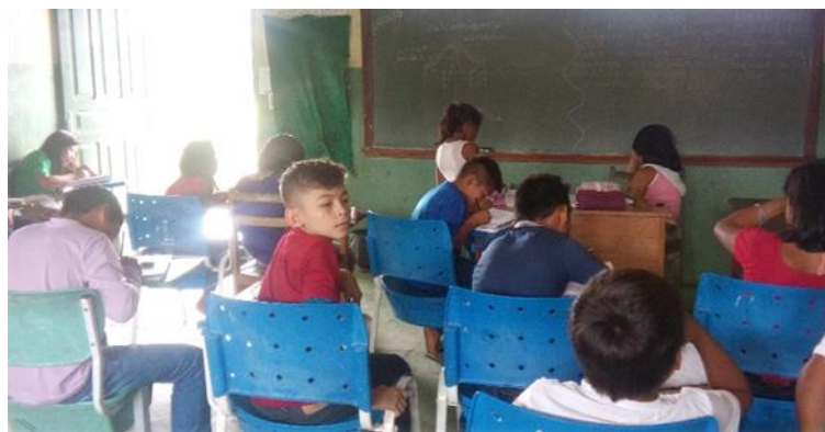
Figura 3. Apresentação e introdução das atividades

Resultados alcançados: Os alunos conheceram o núcleo e tiraram suas dúvidas sobre sua composição, pois acreditavam que era só fogo.