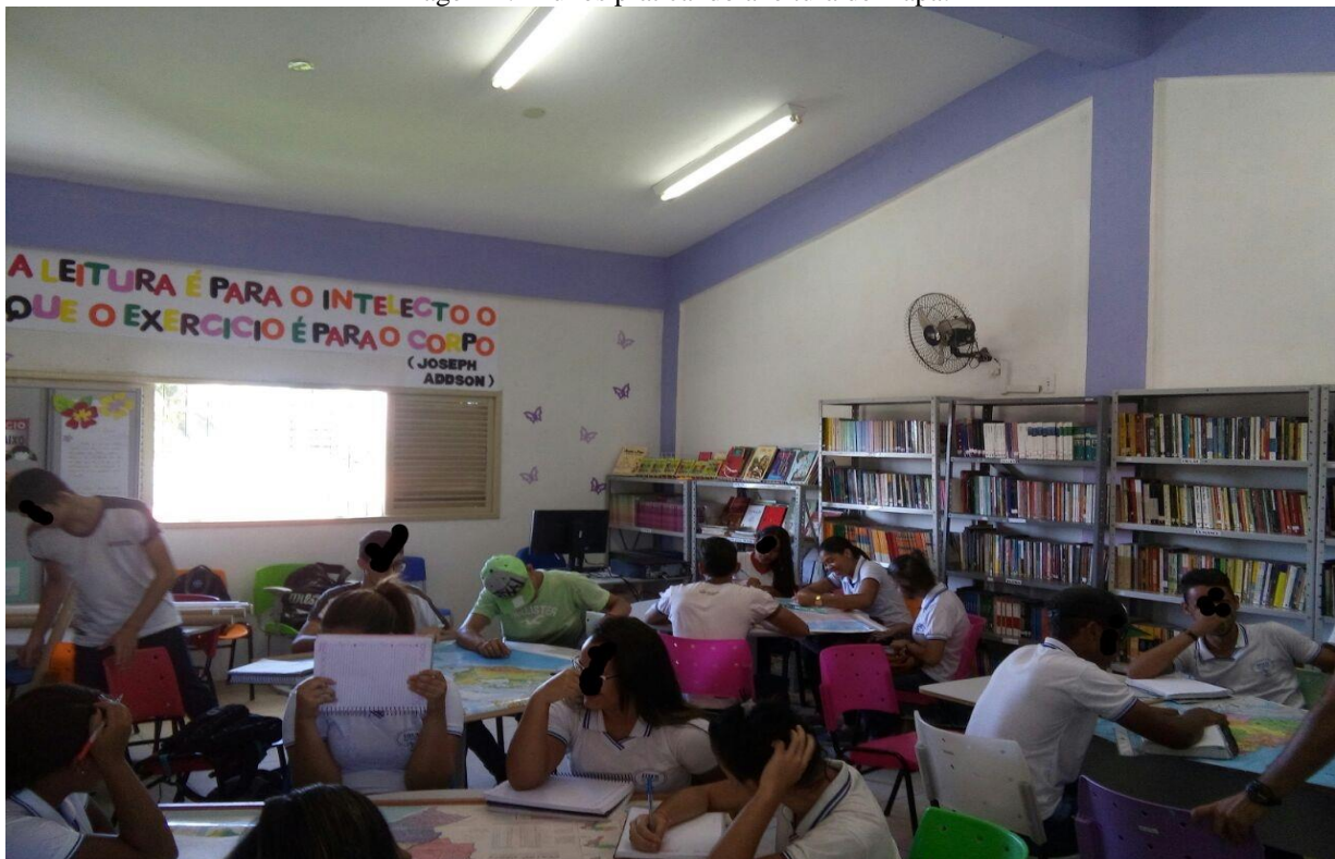
Imagem 2: Alunos praticando a leitura de mapa.

Na aula posterior, os estudantes foram direcionados até a biblioteca da instituição de ensino, em que se dividiram em trios ou grupos com quatro componentes e receberam mapas com mais variados temas e foi repassado o que seria pedido a partir do que foi estudado em sala de aula. Verifica-se isso na próxima imagem.