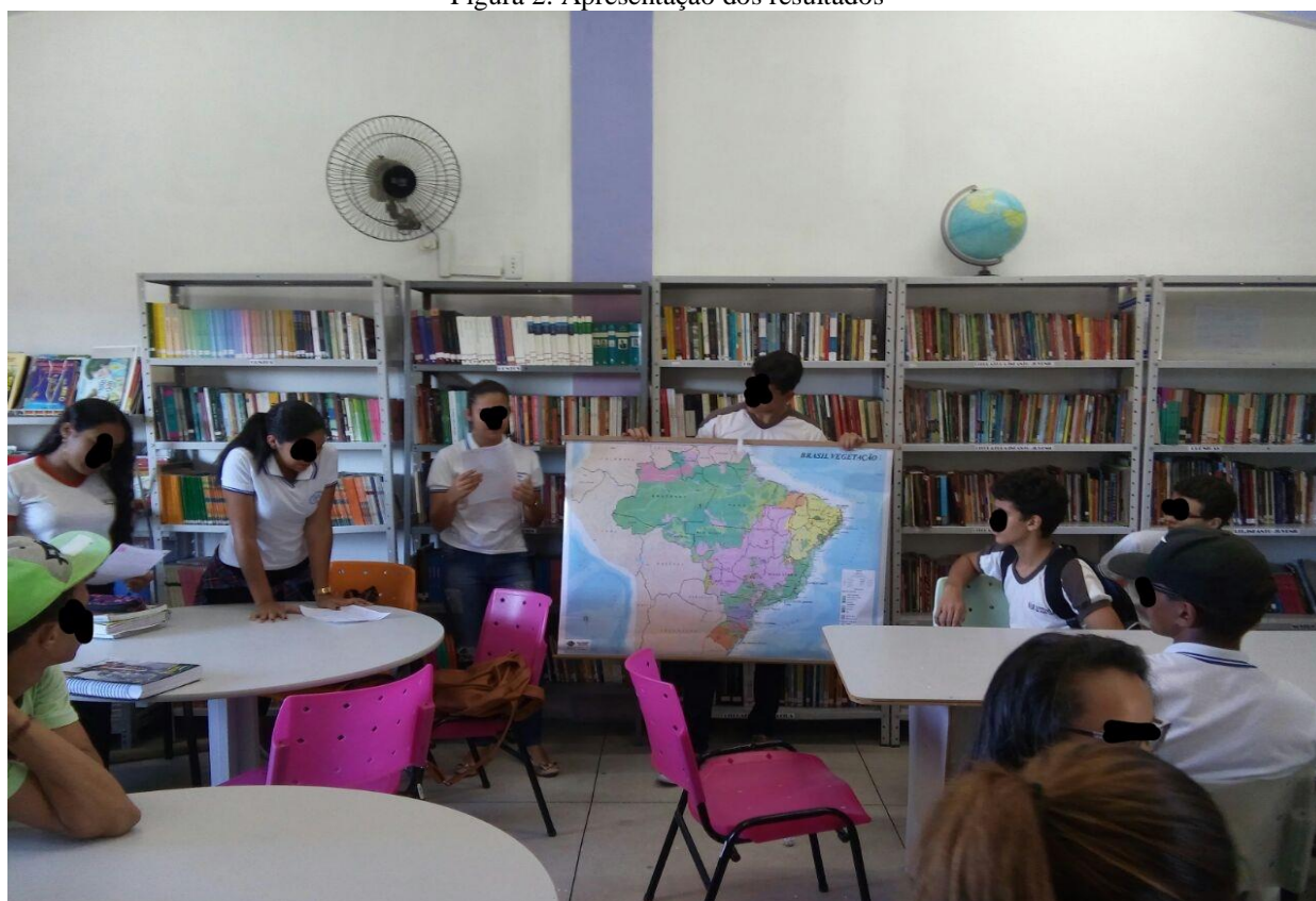
Figura 2: Apresentação dos resultados

No final da pesquisa, os dados analisados e informações encontradas foram expostos e contemplados pela turma em forma de uma pequena apresentação oral e exposição do mapa estudado, mostrando as informações, localização de países e estados, legendas e títulos.