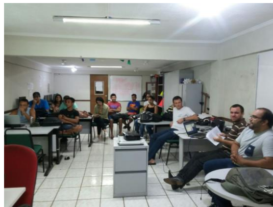
Figura 6. Encontro do

A participação dos estudantes do curso de Licenciatura integrada em Matemática e Física no grupo de estudos de aprendizagem significativa em exatas, passou a ser uma atividade mais recente do LAPMAT. É feito semanalmente um encontro com os professores da instituição responsáveis pelo grupo juntamente com alguns estudantes do curso para discutir temas pré-definidos. A dinâmica nos encontros inicia-se com uma apresentação curta de 20 minutos, feita por um dos alunos, sobre o texto da semana. A ordem de apresentação segue um ciclo previamente definido com a discussão de até uma hora sobre contribuições e dúvidas a respeito do texto.