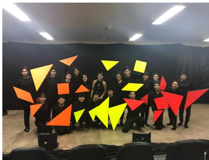
Figura 5. Teatro de tangram