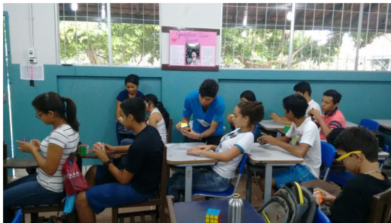
Figura 3. Clubes de Matemática Atividade-cubo mágico