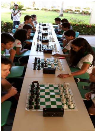
Figura 1. Clubes de Matemática Atividade-Xadrez

Atualmente o projeto clubes de matemática é executado em três escolas no município de Santarém, sendo uma turma do último ano de ensino fundamental e outras três turmas de ensino médio. No projeto é adotado um tipo de roteiro para cada atividade, nele contem os objetivos, os procedimentos metodológicos e os materiais utilizados, um exemplo de roteiro é a atividade de construções geométricas, onde é trabalhado alguns conceitos de geometria, como reta, mediatriz, circunferência, fazendo o uso de régua, compasso e esquadro. Os planejamentos das atividades que são desenvolvidas nos Clubes acontecem no LAPMAT semanalmente, onde são pensados cuidadosamente nos procedimentos a serem utilizados atendendo as demandas de cada turma. Na figura 1, 2, 3 mostram alguns dos momentos das atividades executadas nas escolas.