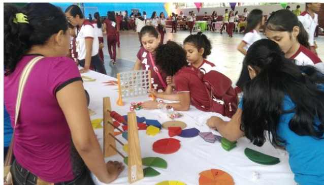
Figura 7. Feira de Matemática

As feiras quando solicitadas acontecem nos espaços das escolas do ensino básico e da universidade. São levados os materiais para exposição como, os discos de frações, ábaco escolar, quina do LAPMAT, xadrez, cruzadinha da matemática, tangram, cubos mágico e etc.