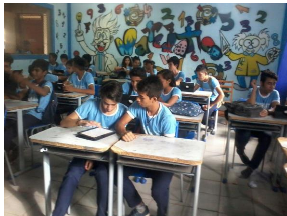
Figura 2. Clubes de Matemática Atividade-Euclídea