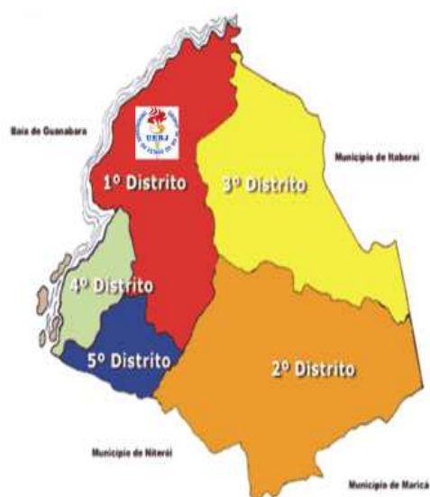
Município de São Gonçalo