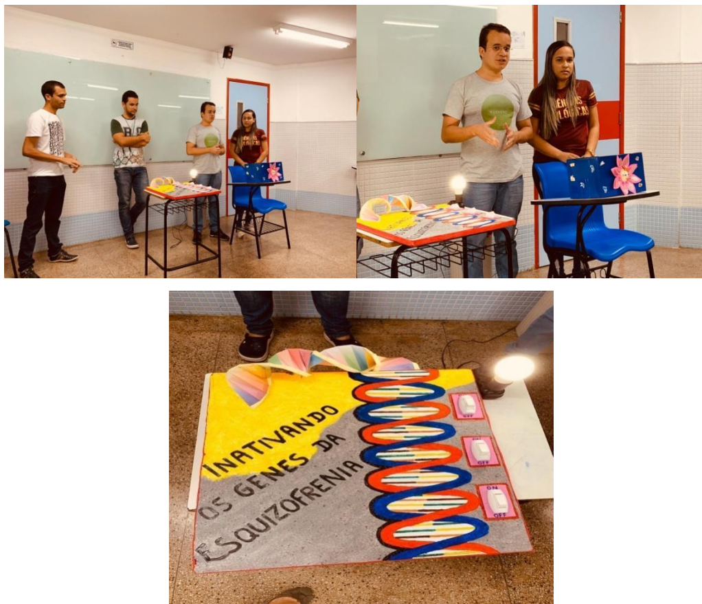
Fotografia 1-3: Aplicação da Atividade “Inativando genes da Esquizofrenia”.

A aplicação das atividades estão demonstradas através das imagens abaixo, onde expõe o momento da exposição dialogada, tendo o jogo de tabuleiro e o teste cognitivo para fins da realização a fim de trazer conhecimento sobre a temática e as dificuldades enfrentadas pelas pessoas com a esquizofrenia. Com base nisso no jogo que fizemos às cegas onde as pessoas precisam colocar a sua mão em uma caixa e tentar descobrir qual o objeto ele estar pegando. Dentro da caixa colocamos matérias como tubo de pasta, tampa de garrafa moedas matérias que podem de certa forma confundi los para que possam estimular seu senso cognitivo.