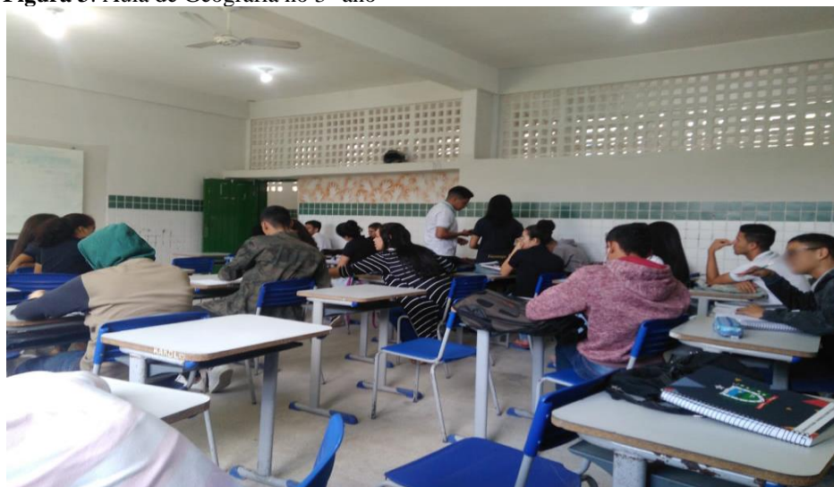
Figura 3: Aula de Geografia no 3º ano

semanais e colocou temas focados naquilo que todo aluno de 3º ano quer focar quando se está preste a sair da escola: Enem. A professora aplicou também um simulado com questões de Geografia para eles se prepararem para o Enem e sua avaliação se deu por meio das apresentações dos grupos, das discussões após as apresentações e do simulado aplicado. Após o Enem, a professora utilizou-se de atividades do livro didático para complementar a nota do último bimestre. Na turma do 6º ano, o único recurso utilizado pela professora foi o livro didático. No 3º ano, no final do bimestre, a professora utilizou-se também o livro didático e, como a maioria das aulas foi apresentações de grupos, o outro recurso que foi utilizado pelos alunos foi o Data show. Poucas vezes, nas duas turmas, se utilizou do quadro para explicar algo ou descrever.