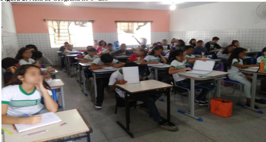
Figura 2: Aula de Geografia no 6º ano

A metodologia de avaliação utilizada pela professora consiste em aplicação de prova e atribuição de notas de acordo com a participação nas atividades exigidas em aulas durante o bimestre. As aulas seguem a sequência de conteúdos do livro didático, de modo que os primeiros 45 minutos ou um pouco mais de cada a professora aborda oralmente um capítulo/conteúdo, logo após, seleciona alguns exercícios e pede que os alunos respondam as atividades em sala e passa outras para responderem em casa. A correção dessas atividades se dá após o “visto”.