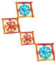
Figura 1: Concepções de alguns autores referente ao protagonismo jovem