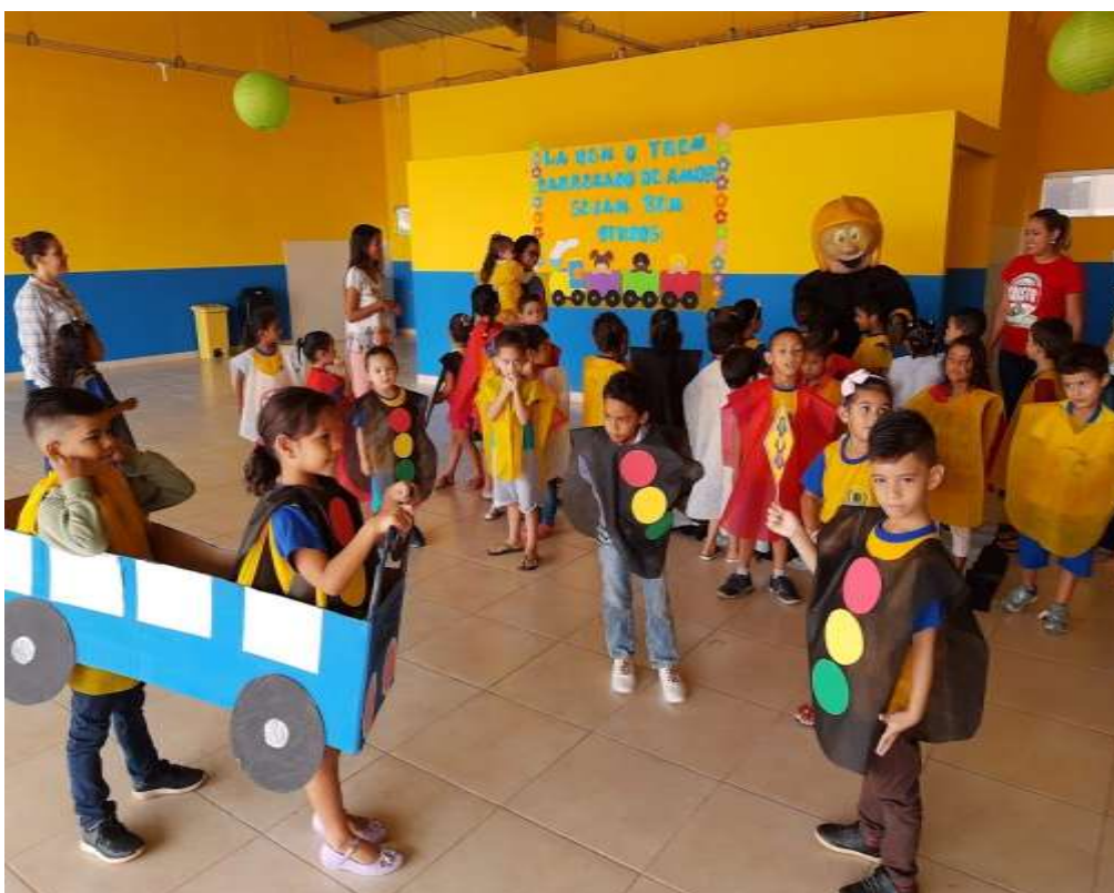
Atividade voltada para conscientização no trânsito