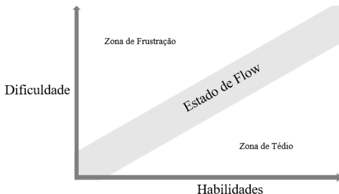
Figura 02 – Gráfico do Estado de Flow