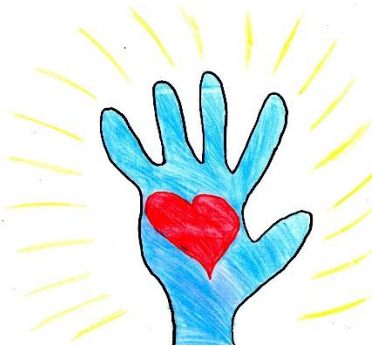
Figura 1 – Comunidade surda

Fonte: desenho elaborado pelo sujeito 1 (2020)