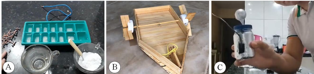
Figura 04 – Trabalhos apresentados por alguns alunos em 2020 e 2021

A figura 04 mostra alguns dos trabalhos desenvolvidos pelos alunos nos dois anos de aplicação da proposta.