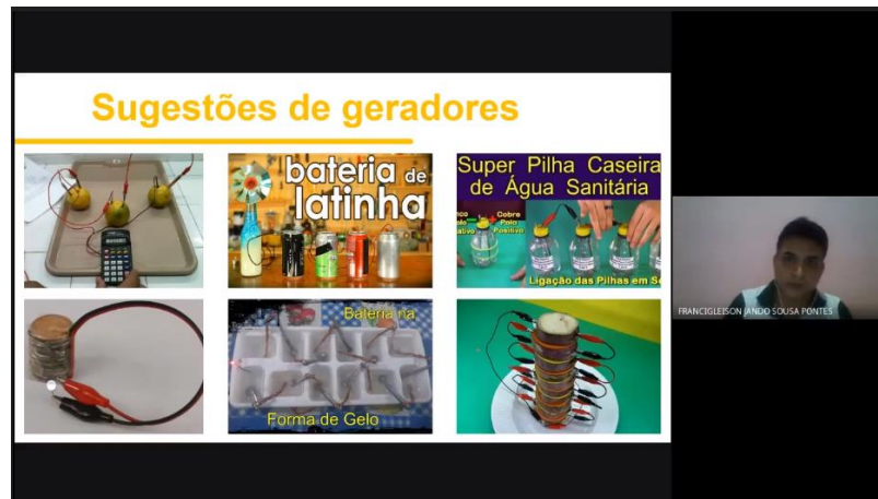
Figura 01 – apresentação de sugestões para realização de experimentos sobre geradores elétricos, através de vídeo aula no Google Meet