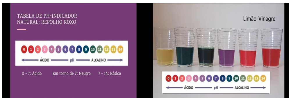
Figura 2 – Imagens do vídeo “Indicador de pH utilizando repolho roxo”

Fonte: vídeo “Indicador de pH utilizando repolho roxo”, 2020.