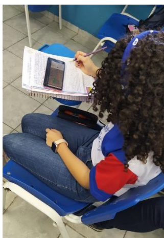
Figura 3 – Utilização do App E-correção para realizar a reescrita, como encerramento das atividades.

Tendo em vista que o texto não é algo acabado, mas sim um processo, após a correção do texto dissertativo-argumentativo, conforme os critérios exigidos pelo ENEM, solicitamos que fizessem a reescrita, em mais duas aulas, para que os discentes efetivassem as correções, como se pode visualizar na figura 3.