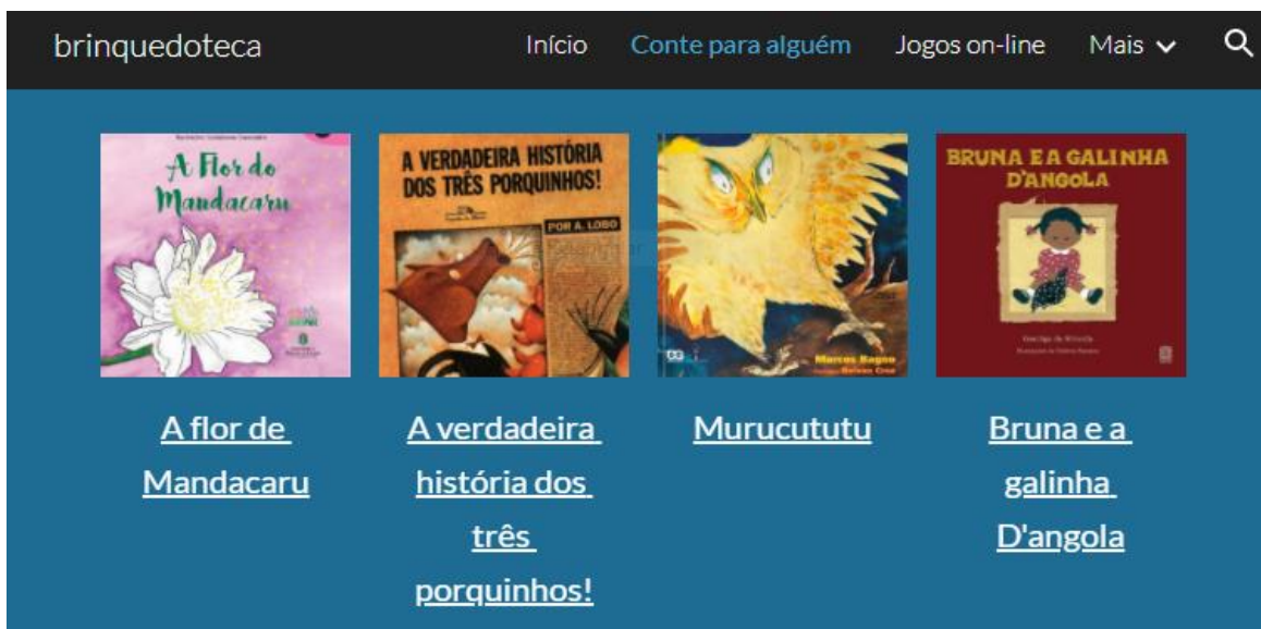
Figura 2: Detalhe da página Conte para alguém

A familiarização com o Google Sites exigiu paciência para compor as páginas, pois nas tentativas de montá-lo ocorreriam erros, sendo necessário refazer todo o processo. A composição de um site não é uma tarefa simples, requer planejar, organizar, selecionar, revisar e incluir conteúdos na página, compreendendo todo um esquema de análise da qualidade do material. O trabalho envolve ainda noções de design que levem em consideração o público-alvo. Para manejar o Google Sites, os conhecimentos aprendidos com as ferramentas Google Docs e Google Drive também foram mobilizados.