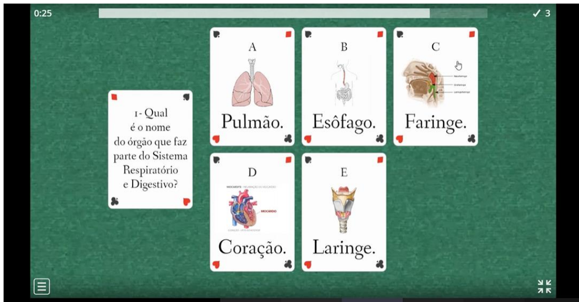
Figura 4. Plataforma Wordwall .

Outro jogo utilizado foi o de baralho, onde um participante escolhia uma carta específica, a mesma era composta por uma pergunta a cerca do conteúdo abordado e surgiam outras cartas com possíveis respostas, os participantes tinham 30 segundos para informarem qual das cartas constava a resposta correta conforme explícito na figura 4.