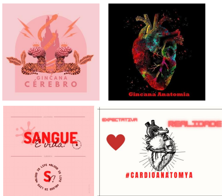
Figura1. Logomarcas da gincana de anatomia online

Após a divisão das equipes, a primeira atividade sugerida foi a criação da logomarca dos grupos, a qual seria utilizada durante todo o decorrer de monitoria no Instagram criado para as atividades da gincana. Como meio de votação e classificação da logomarca vencedora, foram compartilhadas todas as criações no feed do Instagram e a mais curtida tornou-se a logomarca oficial na figura 1 estão representadas logomarcas produzidas pelos alunos. A logomarca vencedora foi a nomeada com gincana cérebro.