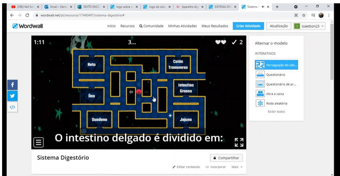
Figura 3. Plataforma Wordwall .

O Wordwall foi uma ferramenta bastante utilizada nas atividades, já que essa plataforma possibilitava com que a monitora transformasse o conteúdo abordado em um jogo de conhecimento dos jovens, que no momento seria utilizado para fins didáticos, um deles foi o jogo Pac-Man que no encontro foi abordado o conteúdo de sistema digestório, nesse jogo era lançado um questionamento, onde existiam alternativas no labirinto, no qual você deveria percorrer até a resposta correta desviando dos obstáculos, o mesmo está representado na figura 3.