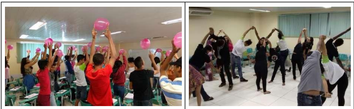
Figura 02. Alunos executando a ginástica laboral.

As questões 04 e 05 abordaram a percepção do monitor sobre sua capacidade de realizar os exercícios da ginástica laboral (Figura 2) e sobre falar acerca do tema. Sendo que 100% sentem-se capazes de realizar a ginástica laboral e apenas 3 monitores não se sentem capazes de falar sobre a ginástica laboral.