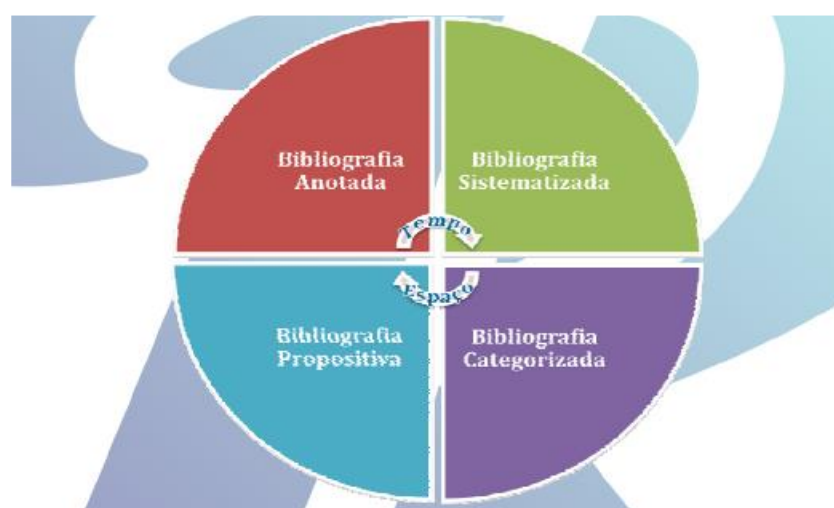
Figura 1: Ciclo da Pesquisa

Essas etapas serão organizadas no seguinte esquema: