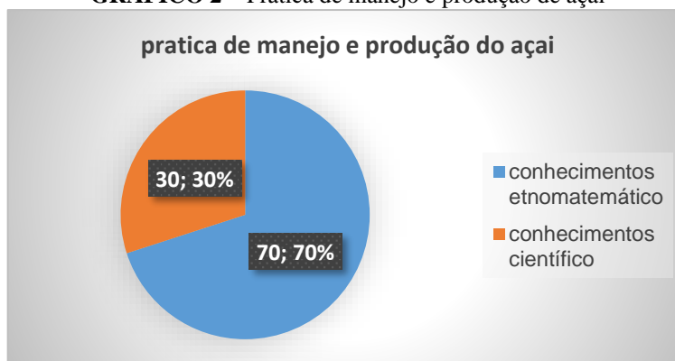
GRÁFICO 2 – Prática de manejo e produção de açaí

prolongada e satisfatório, ou seja, são conhecimentos que pouco se ver no âmbito escola da comunidade. No entanto, conhecimento estes que são de grande importância para a vida rural dos ribeirinhos.