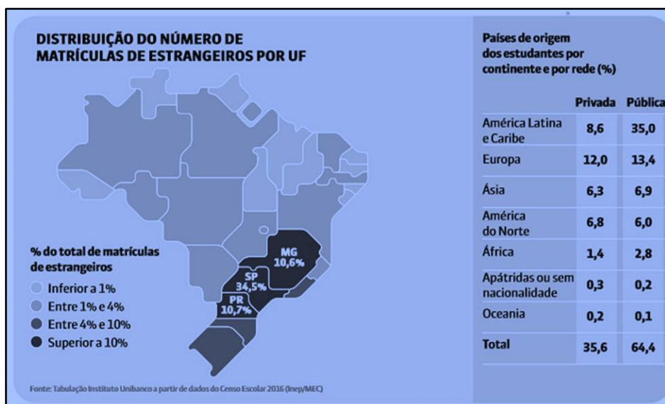
Gráfico 5 - Alunos imigrantes matriculados por estado, 2016-2018.