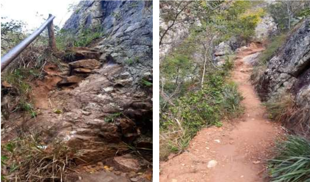
Figura 02. Trilha existente na região.

A educação ambiental deve ser inclusiva e ocorrer de forma horizontal para melhores resultados e por ser algo pertencente e de interesse direto de todos. De acordo com Guimarães (1995), a ampliação da consciência não passa pela perda da consciência individual, mas incorpora nesta os valores de união e solidariedade, de cooperação da vida como um todo, em seu dinâmico equilíbrio planetário. Assim, o indivíduo não é somente uma parte, mas é também natureza se percebendo consciente.