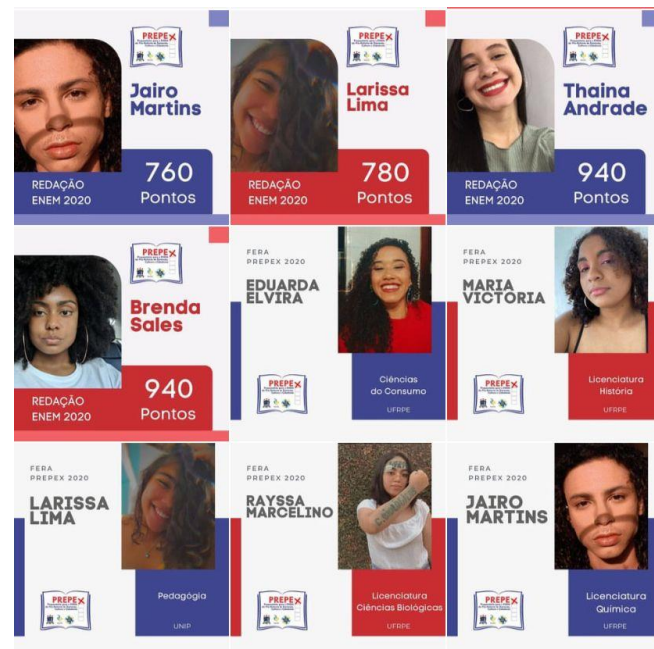
Figura 5. Parte da Grade de Feras PREPEX aprovados no ENEM 2020.

A abordagem de atividades complementares no cronograma do PREPEX resultou em benefícios para os alunos, incluindo aumento de estímulo e envolvimento no processo de aprendizagem, melhor gestão do tempo, fortalecimento das habilidades de escrita, aprofundamento dos conhecimentos e familiaridade com o formato de prova do ENEM. Após a aplicação das diversas atividades supracitadas, um quantitativo significativo de estudantes conseguiram ingressar nas instituições de nível superior. Além disso, as notas de redação aumentaram consideravelmente como mostra a Figura 5.