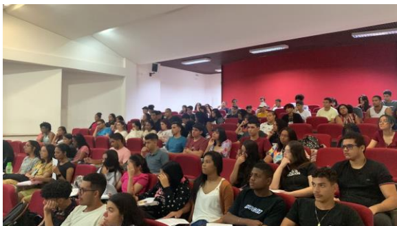
Figura 1. Aulas regulares no PREPEX 2023.