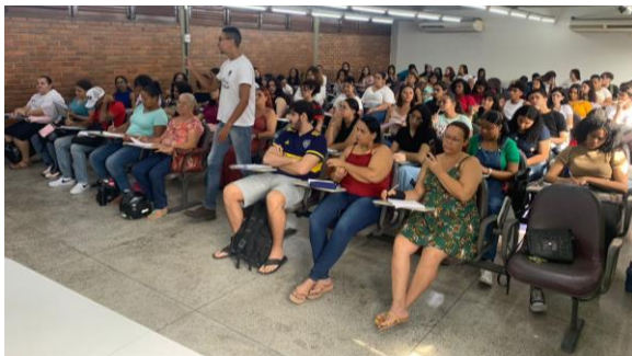
Figura 3. Aulas de Monitoria com resoluções de questões no PREPEX 2022.