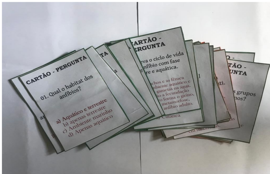
Figura 1 - Jogo Passa ou Repassa dos vertebrados. Cartões-perguntas.