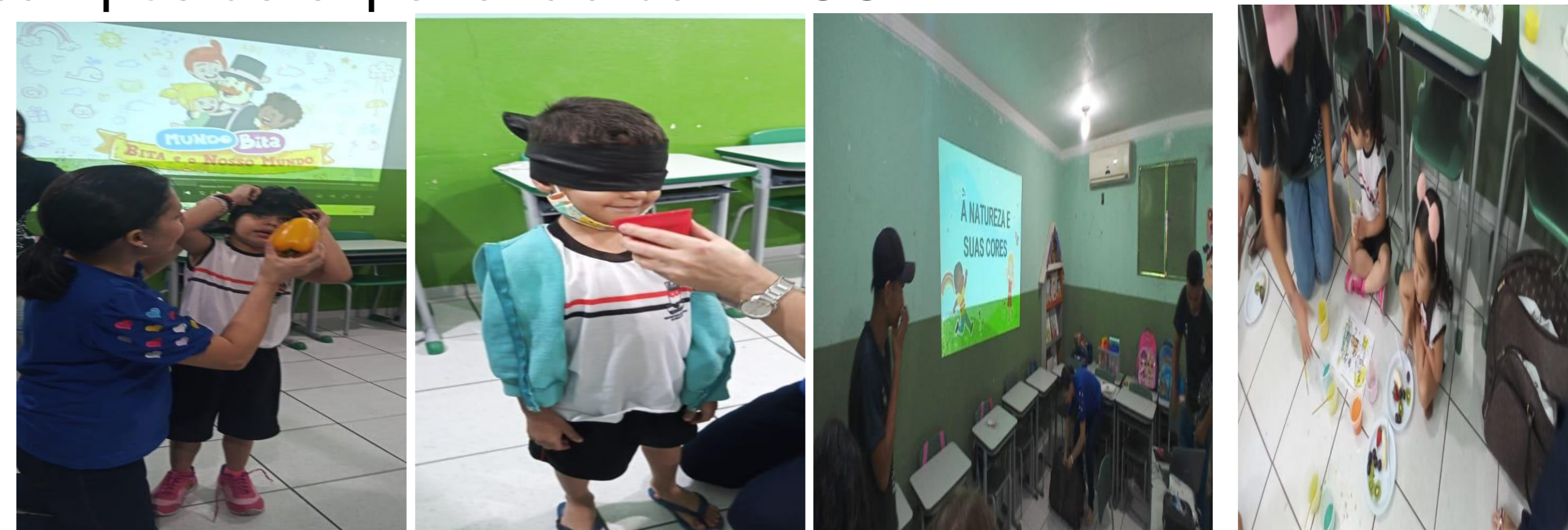
Figura 1,2,3 e 4: Princípios da Carta da Terra (Princípio 5) : Aprenda mais sobre o lugar em que você vive Princípio 8: Estudar sobre a vida na Terra e trocar experiências; Campos de Experiências (O eu, o outro e nós, Corpo, gestos e movimentos, traços, sons, cores e formas;

da BNCC (2017), com seus campos de experiências permite oferecer uma vivência mais significativa. Segue abaixo algumas atividades desenvolvidas com os princípios norteadores da Carta da Terra e a utilização dos campos de experiência da BNCC.