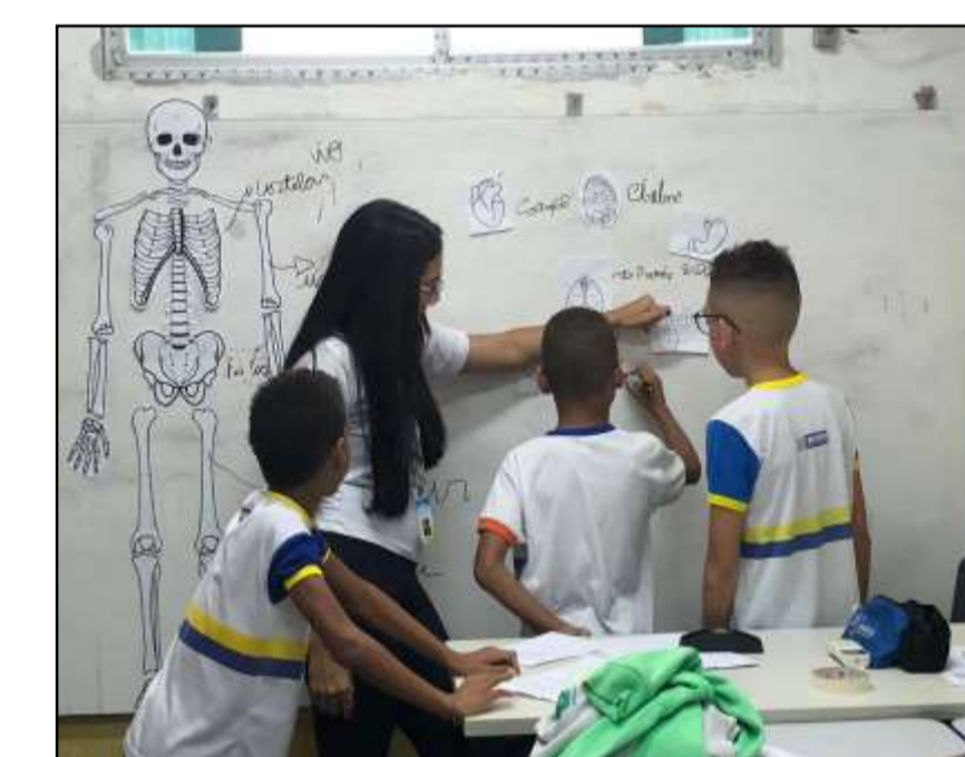
Aula de anatomia