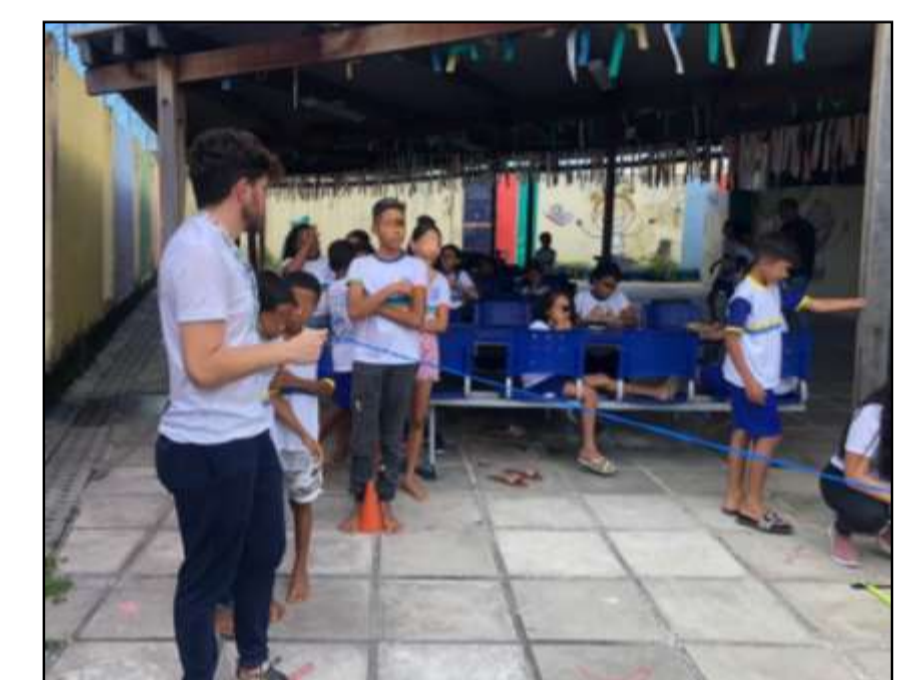
Aula diagnóstica Aplicabilidade do Modelo Bidimensional da Ampulheta Heurística de Gallahue e Ozmun (2003)