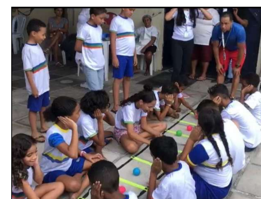
Aula de habilidades motoras