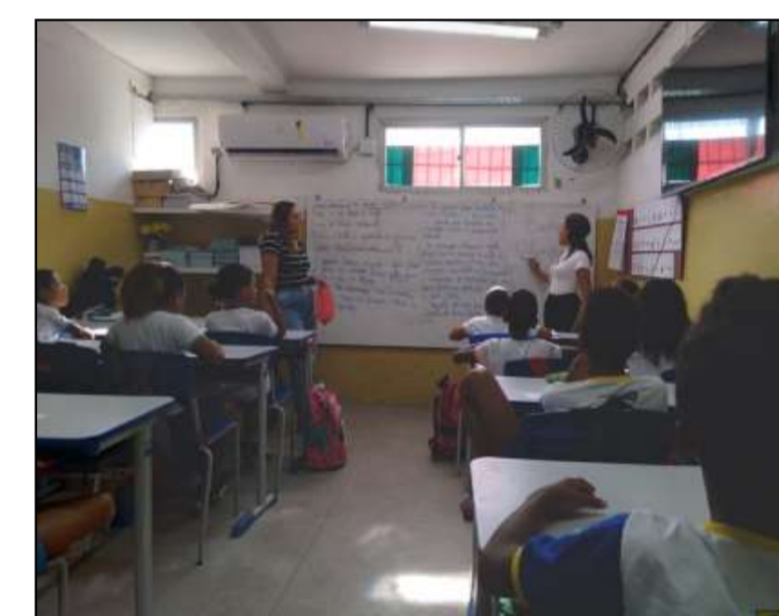
Aula sobre a cultura popular

Diante das experiências vivenciadas, foi possível notar que as danças populares, trabalhadas de forma interdisciplinar, contribuiu de forma significativa para o processo de ensino-aprendizagem das crianças, visto que, a linguagem da dança é uma área privilegiada para que possamos trabalhar, discutir e problematizar os aspectos sócio-político-culturais existentes em nossa sociedade, dialogando sempre com outras disciplinas.