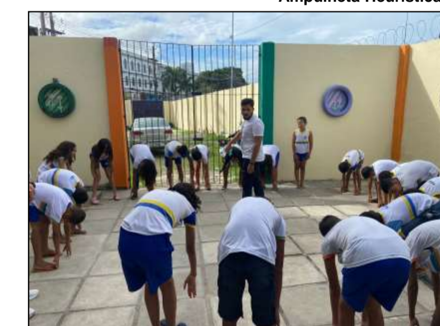
Aula de consciência corporal