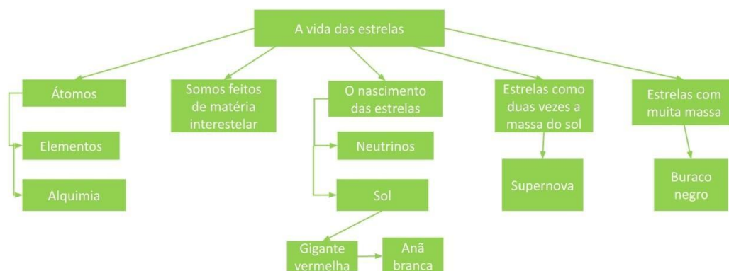
Imagem 2- mapa conceitual do capítulo 9.

Após a elaboração dos mapas conceituais, a turma foi dividida em grupos e cada um ficou responsável por um capítulo do livro para ser apresentado em forma de seminário em sala de aula (imagem 3).