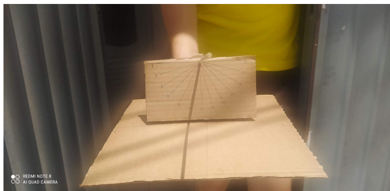
Figura 1 e 2- relógio de sol em horários diferentes do mesmo dia.