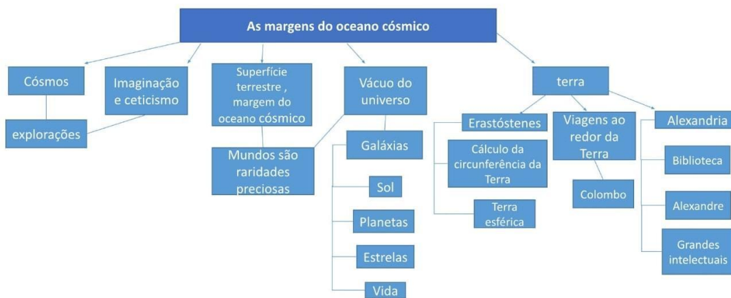
Imagem 1- mapa conceitual do capítulo 1.

Com isso, foram feitos mapas conceituais sobre cada capítulo do livro(imagem 1 e 2).