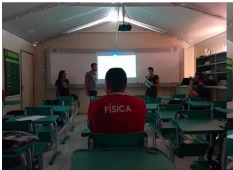
Imagem 3- Apresentação do seminário.

Após a elaboração dos mapas conceituais, a turma foi dividida em grupos e cada um ficou responsável por um capítulo do livro para ser apresentado em forma de seminário em sala de aula (imagem 3).