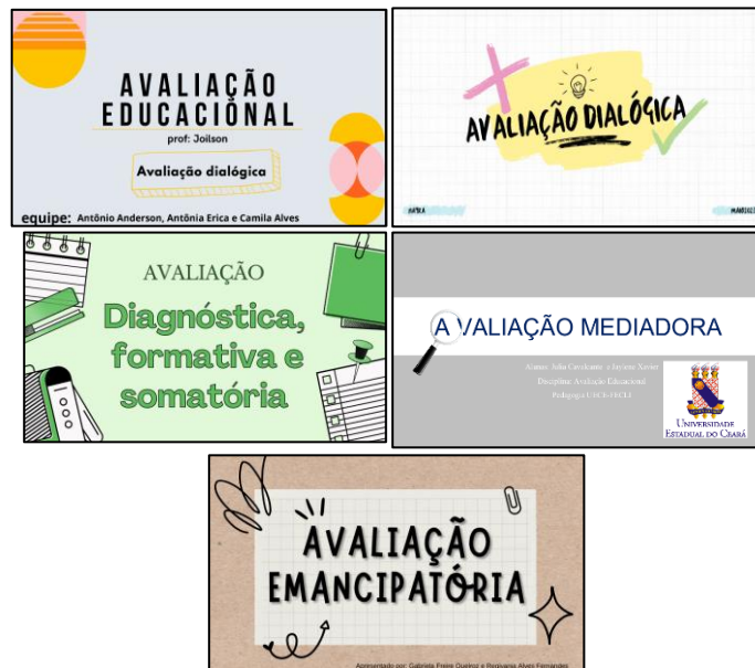
Figura 2 – Capa das apresentações dos trabalhos

As apresentações aconteceram de forma sistematizada em dois encontros e cada equipe após a apresentação ficava à disposição do professor, monitora e grupo de alunos para responderem perguntas concernentes ao conteúdo apresentado. Na figura a seguir, disponibilizamos a capa de apresentação dos materiais expostos pelas equipes: