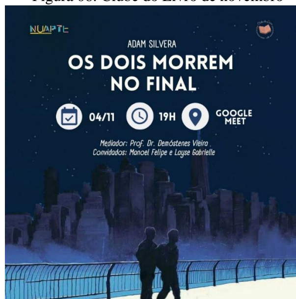
Figura 06: Clube do Livro de novembro