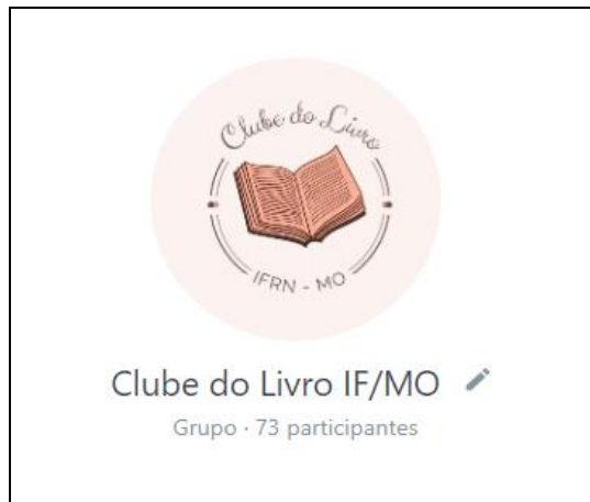
Figura 01: Grupo do WhatsApp

Com relação às redes sociais, destacamos o uso do Grupo do WhatsApp (com cerca de 73 membros), a página no Instagram tem 206 seguidores e o Google Meet, plataforma onde realizamos os encontros mensais: