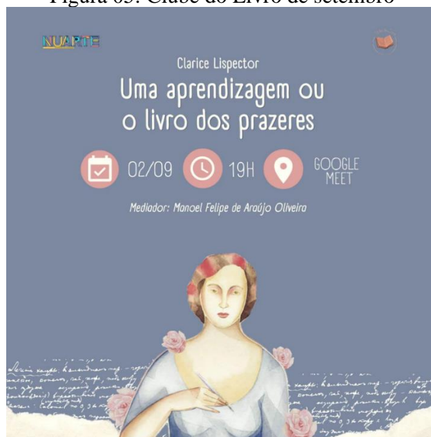
Figura 05: Clube do Livro de setembro