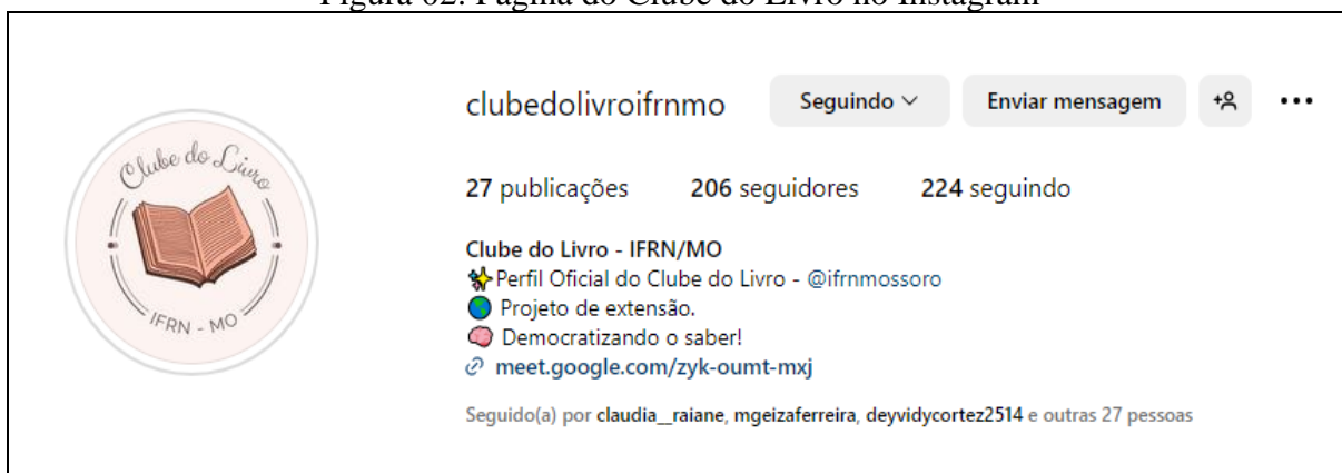
Figura 02: Página do Clube do Livro no Instagram