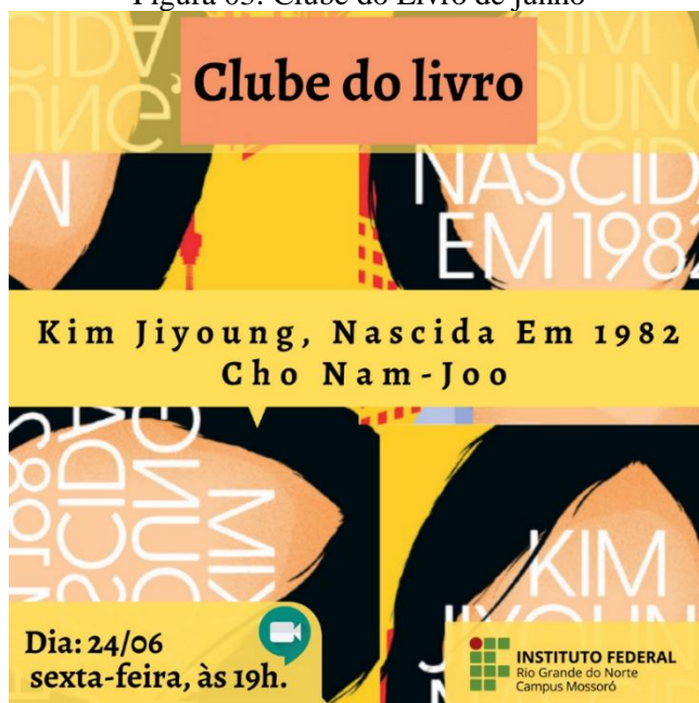
Figura 03: Clube do Livro de junho

Detaca-se o fato de que a disposição dos elementos deve seguir uma lógica de leitura, orientando o fluxo visual do leitor e facilitando a assimilação das informações. Nesse contexto, é necessário que os elementos verbais e não-verbais se apresentem de forma harmoniosa, com foco no objetivo do enunciador.