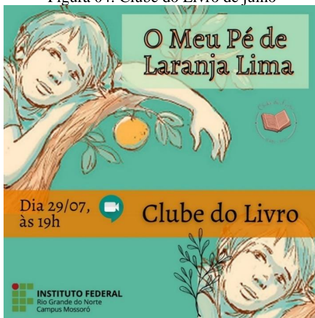
Figura 04: Clube do Livro de julho