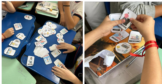
Imagem 9 e 10 — Crianças jogando a dinâmica de conjugação verbal