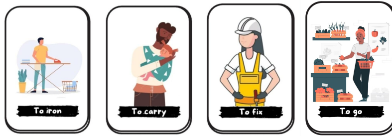
Fotos 2, 3, 4, 5, - Cartas retangulares do jogo.

a reflexão sobre a distribuição do trabalho doméstico e do cuidado entre homens e mulheres, em conjunto com a construção de orações e aquisição de vocabulário em língua estrangeira. As cartas retangulares apresentaram as ações, que deveriam ser associadas, com o apoio imagético, ao conjunto de palavras para formar-se frases obtidas nas cartas circulares, como observadas abaixo: