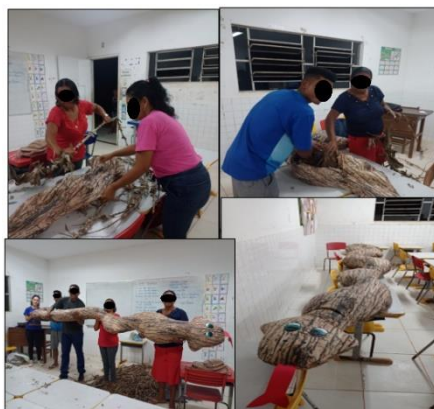
Figura 1 – Discentes da EJAI em atividade da FLEG