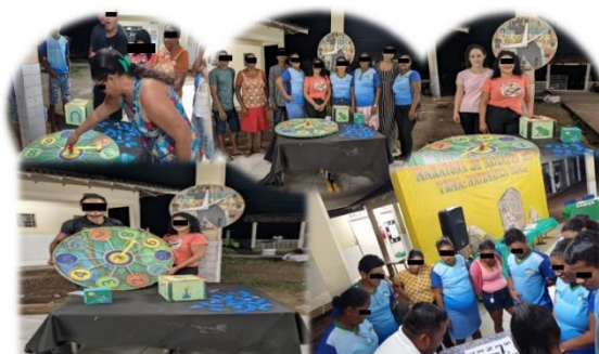
Figura 2 - Discentes da EJAI na Maratona de Matemática